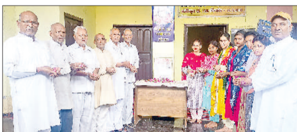
महारानी लक्ष्मीबाई के चित्र पर पुष्प अर्पित करके नमन करते हुए नागरिक।