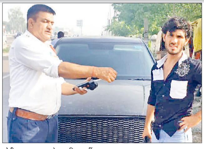
सोनीपत। चालान काटते हुए पुलिस कर्मी।

सोनीपत ट्रैफिक पुलिस द्वारा सड़क सुरक्षा सुनिश्चित करने के उद्देश्य से चलाया जा रहा विशेष अभियान लगातार जारी है। आलम ये है कि एक ही हफ्ते में सोनीपत पुलिस ने कुल 549 वाहनों के चालान काट दिए हैं। इन चालान के तहत 12 लाख 57 हजार रुपये का जुर्माना भी किया गया है। इस अभियान में लेन ड्राइविंग नियमों, बिना हेलमेट, ट्रिपल राइडिंग, ब्लैक फिल्म, बुलेट पटाखा, रेड/ब्लू लाइट और ड्रंक एंड ड्राइव जैसे गंभीर उल्लंघनों पर विशेष फोकस किया गया।