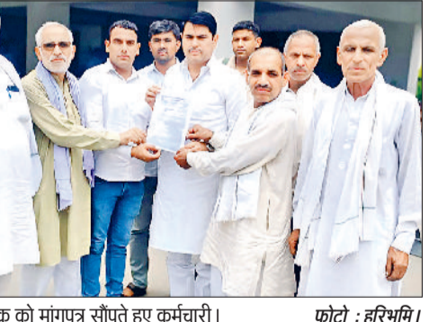
गोहाना। विधायक को मांगपत्र सौंपते हुए कर्मचारी।