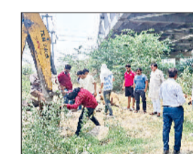
सोनीपत। गावों को दफन करने के दौरान मौके पर मौजूद सीनियर डिप्टी मेयर एवं अन्य।