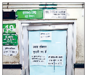
सोनीपत। हड्डी रोग विशेषज्ञ की ओपीडी के गेट पर वस्था नोटिस

नागरिक अस्पताल में एक्सरे विभाग में मरीजों को मिलने वाली सेवाओं में दो दिन से उठक-पटक चल रही है। विभाग के कर्मचारियों द्वारा