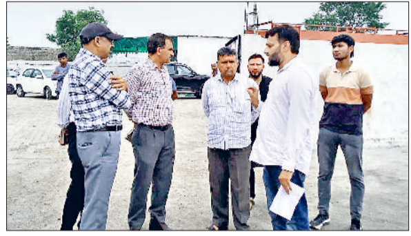
खरखौदा। एजेंसी संचालक से पूछताछ करते अधिकारी।