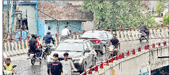
सोनीपत। हल्की बूढ़ाबांदी के बीच गुजरते वाहन।

तापमान में गिरावट बरकरार, 32 डिग्री पर रहा पारा