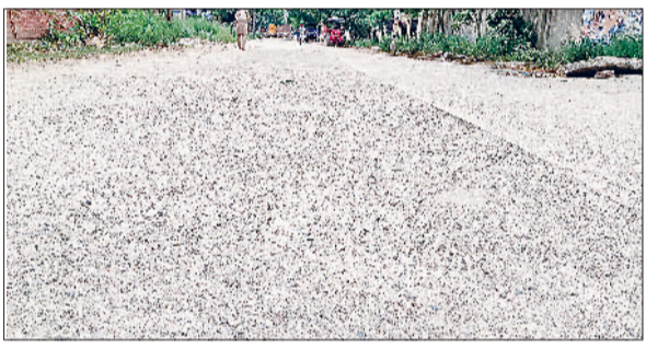
गन्ना। डेढ़ साल बाद ही सड़क से उखड़ी परतें।

माडल संस्कृति स्कूल से गढ़ी केसरी बैडमिंटन हाल तक बनाई गई सड़क महज डेढ़ साल में ही टूटने लगी है। सड़क की जगह-जगह से परत उखड़ चुकी है और गड्ढे बन गए हैं। इससे राहगीरों को भारी परेशानी का सामना करना पड़ रहा है। जानकारी के अनुसार, नगरपालिका द्वारा खेल स्टेडियम से लेकर राजकीय माडल संस्कृति स्कूल तक सड़क सुदृढ़ीकरण पर करीब 54.63 लाख रुपये की राशि खर्च की गई थी। लेकिन निर्माण कार्य की गुणवत्ता पर अब स्थानीय लोगों ने सवाल उठाने शुरू कर दिए हैं। लोगों का कहना है